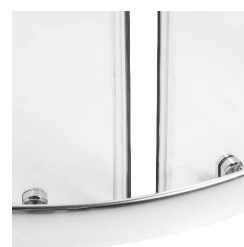
CHROMOWANE ROLKI DOLNE I GÓRNE