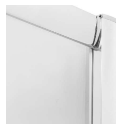
PODWYŻSZONY BLASK PROFILI